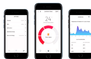
Fumis AIR app