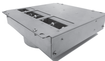
Dimensioni: 255 x 260 x 50 mm