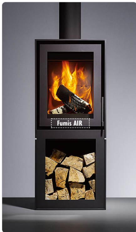
Posizionamento del controller

L'FUMIS AIR È UN SISTEMA CHE VI PERMETTE DI AUTOMATIZZARE IL PROCESSO DI COMBUSTIONE NELLE STUFE A LEGNA E NEI CAMINI.